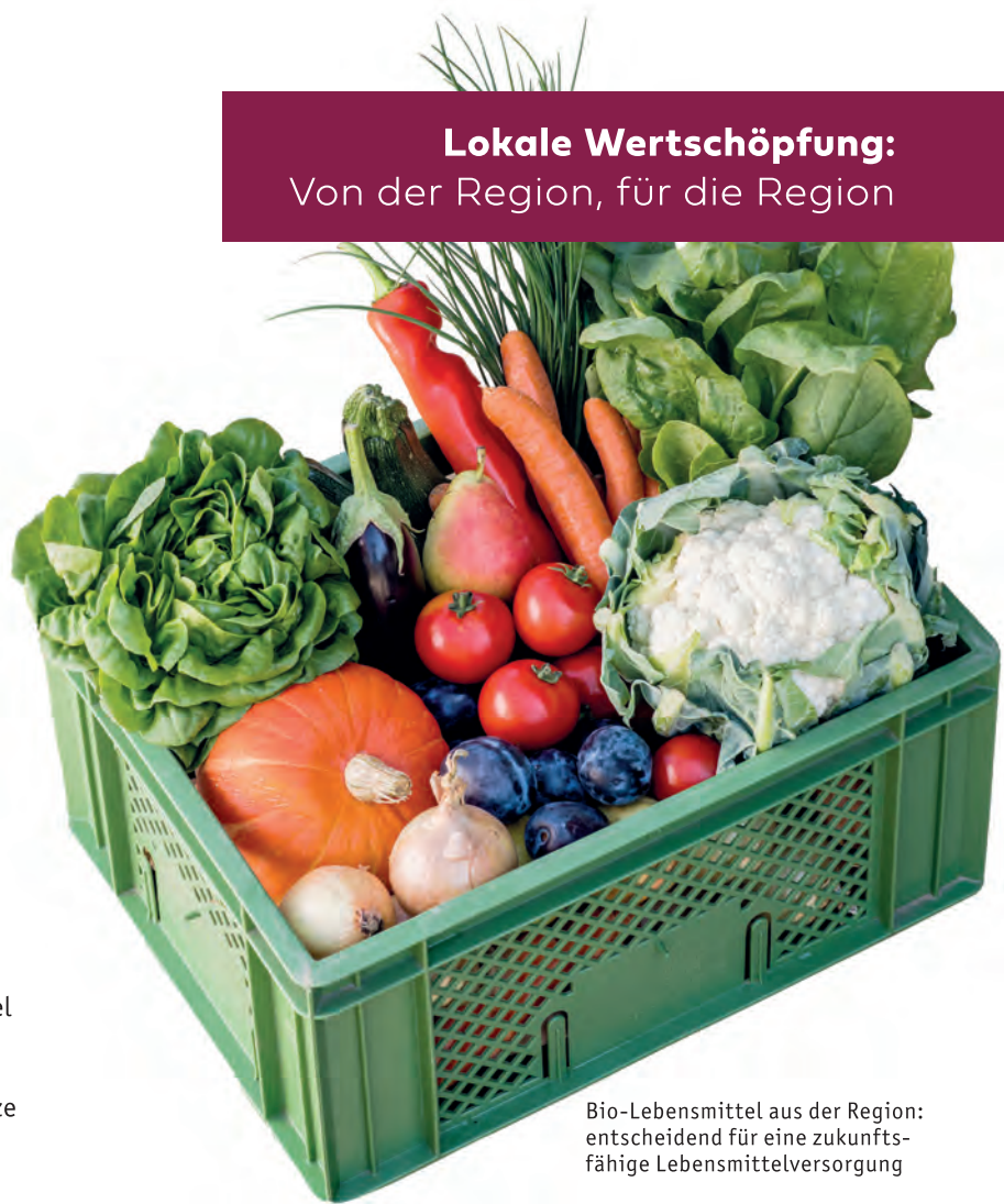
Bio-Lebensmittel aus der Region: entscheidend für eine zukunftsfähige Lebensmittelversorgung

Die Kooperation mit regionalen Bio-Erzeuger*innen ist für jeden Ökokisten-Betrieb verpflichtend, die meisten Ökokisten-Betriebe haben ohnehin auch selbst einen eigenen Anbau. Durch langfristige Abnahmezusagen bieten wir unseren Erzeuger*innen Planungssicherheit und fördern die Produktion von 100 % Bio in den Regionen. Das sorgt für sichere Arbeitsplätze und hilft, Kulturlandschaften zu bewahren.