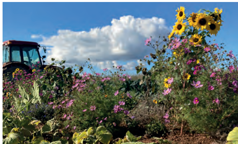
Der ökologische Landbau fördert die Artenvielfalt und erhält die Biodiversität.